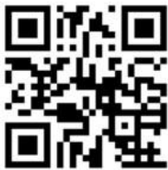
Coastal Radar (Website)