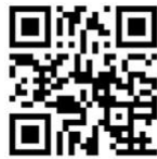
Coastal Radar (Website)